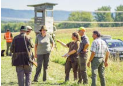
Die Richtergruppe am Wasser