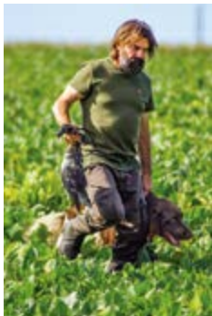
Bergil ze Tri kraju nach dem Verlorenbringen