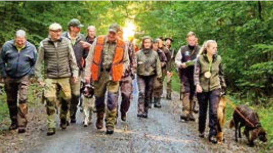
Auf dem Weg...zum Hindernis