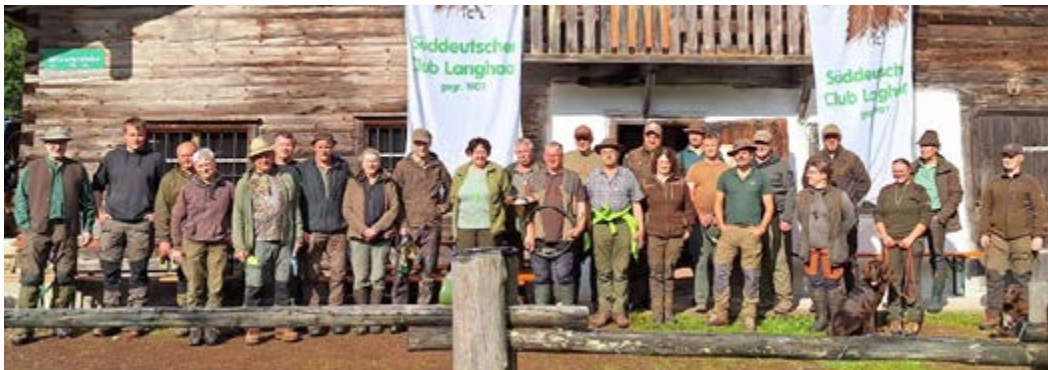
Gruppenbild vor der Mösererstube

Insgesamt stellten sich vier Gespanne der Verbandsschweißprüfung auf der 20- Stunden-Fährte, fünf Gespanne der 20-Stunden-Verbandsfährtenschuhprüfung und ein Gespann der 40-Stunden-Fährtenschuhprüfung. Die Fährten wurden gemäß der Prüfungsordnung am Donnerstag bzw. am Freitag von den zwölf Richtern gelegt.