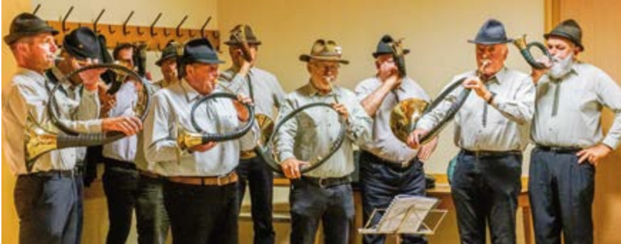
Stilvolle Eröffnung des Festabends durch die Bläser

helfenden Hände im Hintergrund. Schön war es im Steigerwald. Nächstes Jahr treffen wir uns alle in Tschechien, nicht zuletzt bei der berühmten tschechischen Pirsch. Horrido und Waidmannsheil!