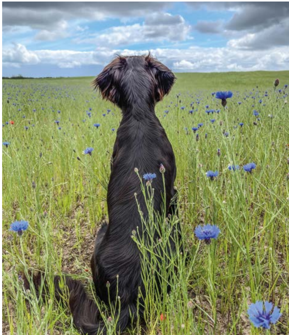
Ari vom Fördehof