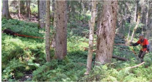
Auf der Fährte

Wie es in Unken Tradition ist, trafen sich Richter und Führer schon am Freitagabend zu einem gemütlichen Beisammensein, bei dem gemeinsam gegrillt, gefeiert und natürlich ausführlich „gehündelt“ wurde.