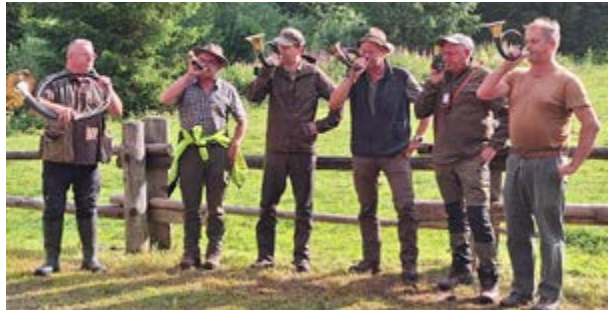
Die anwesenden Bläser

Am 12. Juli 2025 trafen sich zehn Hundeführer (9 Deutsch-Langhaar, ein Weimaraner Kurzhaar) aus ganz Süddeutschland zur Verbandsschweiß- und fährtenprüfung Unken, die mittlerweile zu den renommierten deutschen Schweißprüfungen gezählt werden kann. Ziel ist vor allem die Vorbereitung der Gespanne auf den Einsatz in der jagdlichen Praxis. Sowohl Hund als auch Führer müssen zeigen, dass sie im Ernstfall den Herausforderungen und Schwierigkeiten einer Nachsuche auf verletztes Wild gewachsen sind. Die Prüfungen finden seit vielen Jahren in den Saalforsten Unken statt. Die diesjährige Veranstaltung war dem im letzten Jahr verstorbenen Roland Ostheimer, einem Urgestein und der guten Seele der Unken Prüfungen, gewidmet. Vor der Mösererstube, dem traditionsreichen Suchenlokal, das auf 1200m Höhe im Prüfungsrevier gelegen ist, würdigten ihn die anwesenden Jagdhornbläser mit einem letzten Halali.