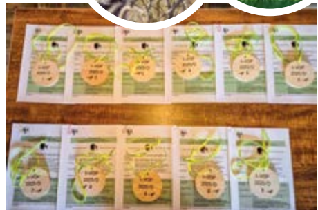
Startnummern und Programme