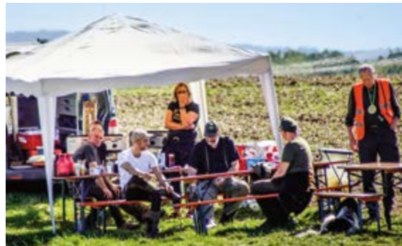
Verpflegungsstation am Wasser